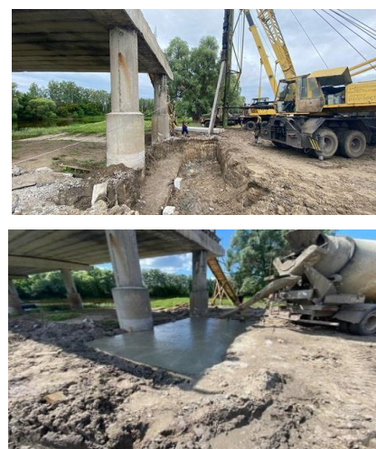
Рис. 3. Реалізація інженерних рішень щодо влаштування додаткових палевих фундаментів

При відновленні мостів по старій осі реалізовані інженерні рішення щодо влаштування додаткових палевих фундаментів з об'єднанням їх в загальну конструкційну систему з існуючими фундаментами (Тарасенко, 1972а та 1972б). Палі об'єднувались в сумісну роботу за допомогою монолітного залізобетонного ростверку (рис. 3).