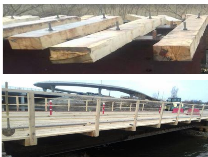
Рис. 4. Інженерні рішення щодо влаштування проїзної частини

Проїзна частина відокремлювалась від тротуару колесо відбійником – брус 100 \times 100 мм по всій довжині мосту (рис. 4).