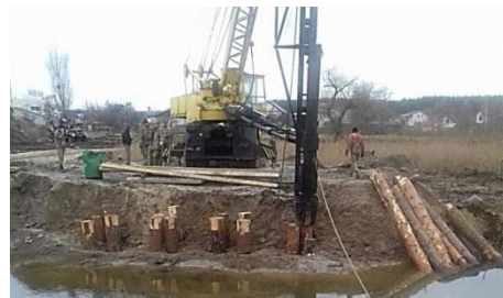
Рис. 2. Забивка дерев'яних палей за допомогою агрегату УСА з навісним обладнанням на автокрані дизель-молотом УР-1250

З метою індустріалізації робіт, збірка основних елементів, будов, конструкцій (СРП-18; 23, ІМІ 60; МІК-С), виконувалася як правило в пунктах постійної дислокації, полігонах і будівельних майданчиках поряд з об'єктами відновлення що сприяло перетворенню основних процесів робіт на швидкісні процеси монтажу. Для реалізації проектних рішень у зв'язку з незначною висотою мостів було прийнято рішення використовувати дерев'яні палеві опори. Забивка дерев'яних палей здійснювалася за відповідними технологічними схемами за допомогою агрегату УСА з навісним обладнанням на автокрані дизель-молотом УР-1250 (рис. 2).